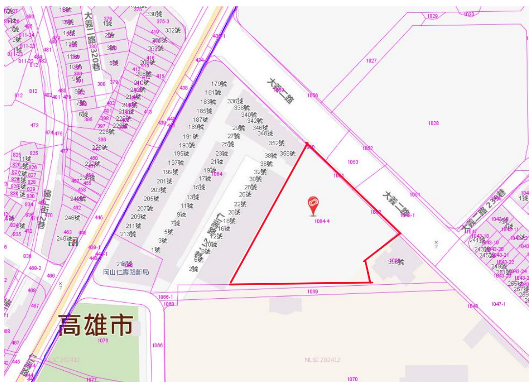
圖 1. 基地位置示意圖